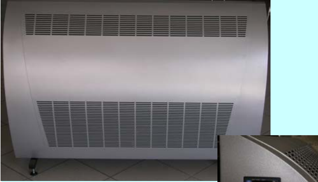
Higrosztát DRY Precision